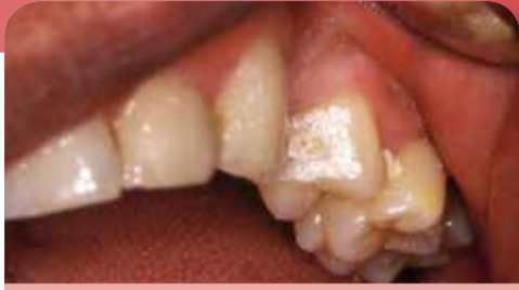
Effet de l'erbiumyag sur les tissus durs