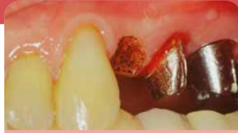
Plastie pré-prothétique des tissus mous