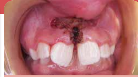
Frénectomie au laser CO2