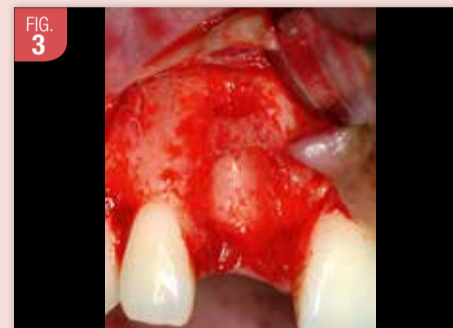
La perte osseuse est importante et la fine corticale résiduelle présente une déhiscence associée à une fenestration.