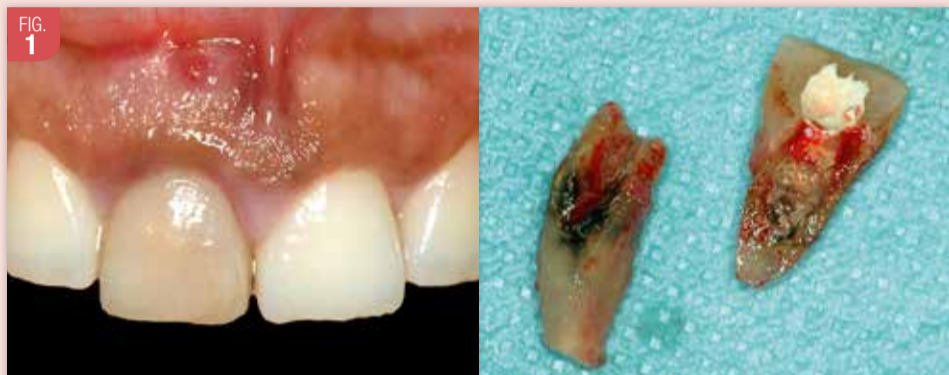
Une fistule est présente à l'aplomb de la dent 11 fracturée longitudinalement.

Stratégie chirurgicale : l'extraction, la mise en place de l'implant, le pilier de cicatrisation, ainsi que le comblement osseux associé à la mise en place d'une membrane de collagène stabilisée à l'aide de pins en titane seront pratiqués lors d'une seule et unique intervention.