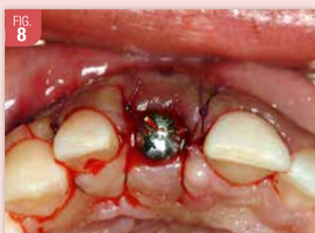
Les lambeaux sont ensuite suturés par des points simples. Une prothèse partielle adjointe est installée pour la durée de la cicatrisation. L'intrados est corrigé afin de ne pas interférer avec le pilier de cicatrisation.