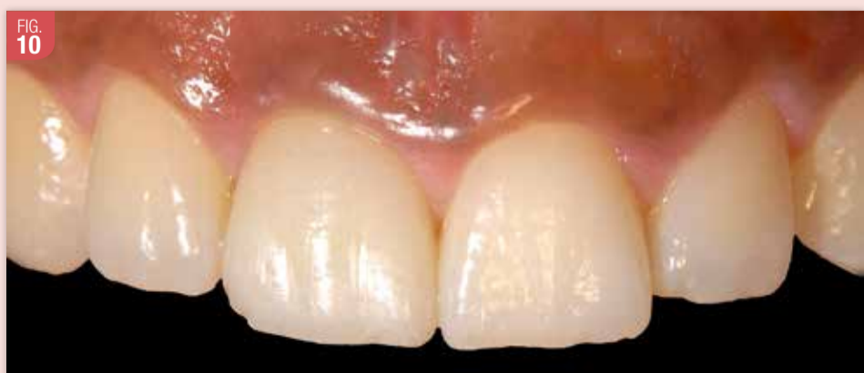
La prise de vue finale permet d'apprécier la morphologie de la couronne implanto-portée, ainsi que les caractérisations de surface. La couleur et la texture de la gencive ont été maintenues. La ligne des collets est harmonieuse et les papilles sont présentes intégralement.

Une seule intervention a été réalisée pour le remplacement de cette incisive centrale, et ce, de la manière la moins invasive possible.