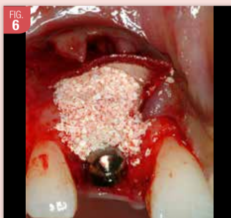
La membrane ainsi fixée est ensuite réclinée, et les défauts osseux sont comblés à l'aide d'un biomatériau non résorbable (Bio-Oss®, Geistlich).