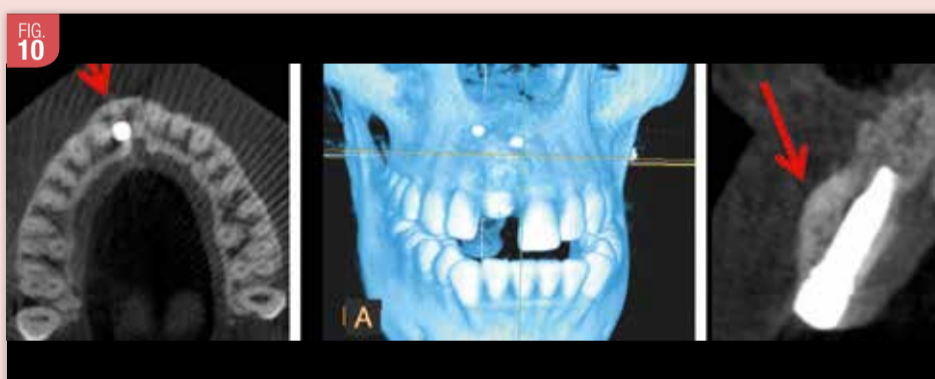
Les différentes images radiographiques tridimensionnelles de type Cone Beam attestent de l'augmentation osseuse obtenue grâce à la ROG. La corticale vestibulaire reconstituée présente une épaisseur minimum de 2 mm, garantissant ainsi la stabilité des tissus mous péri-implantaires.