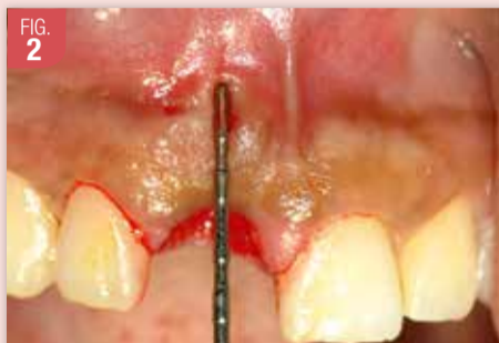
La profondeur de la lésion, évaluée à l'aide d'une sonde appliquée sur la gencive, impose l'élévation du lambeau vestibulaire afin d'objectiver l'étendue de la totalité des défauts osseux avec précision.