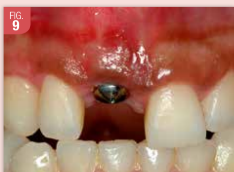
Aspect clinique à 3 mois post-opératoires. La convexité des tissus mous est présente, et la bande de TK est bien présente, donnant l'illusion de la présence d'une racine naturelle. Noter la disparition de la fistule vestibulaire.